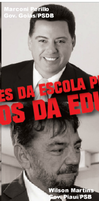
Marconi Perillo Gov. Goiás/PSDB