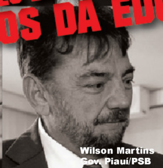
Wilson Martins Gov. Piauí/PSB