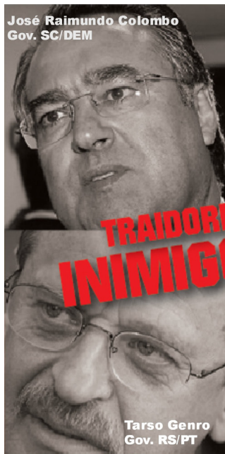
José Raimundo Colombo Gov. SC/DEM

Com o recuo e a pauta de reivindicação de professores e administrativos sul mato-grossenses atendida,