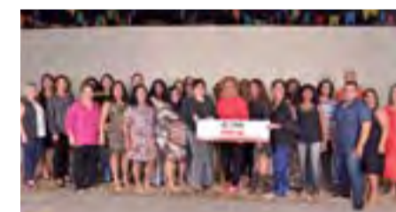
Regional de Jataí demonstra entusiasmo para seguir defendendo a escola pública de qualidade