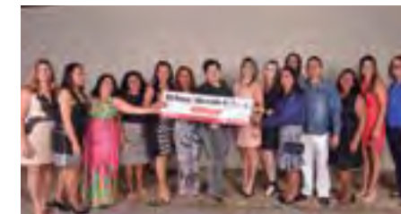
Regional de Alvorada e Posse trouxe grande delegação para a festa no Clube Jaó