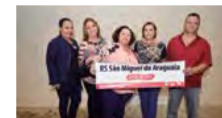
Regional São Miguel do Araguaia com muita garra para vencer os desafios futuros