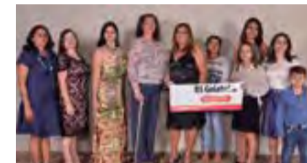
Regional de Goiatuba trouxe comitiva para a festa da posse