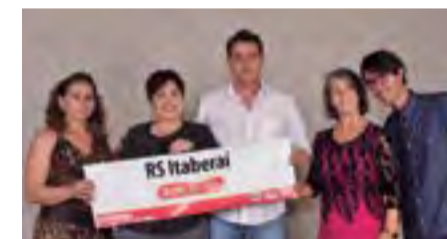
Regional de Itaberaí organizada para dar garantias mais avanços para a Educação