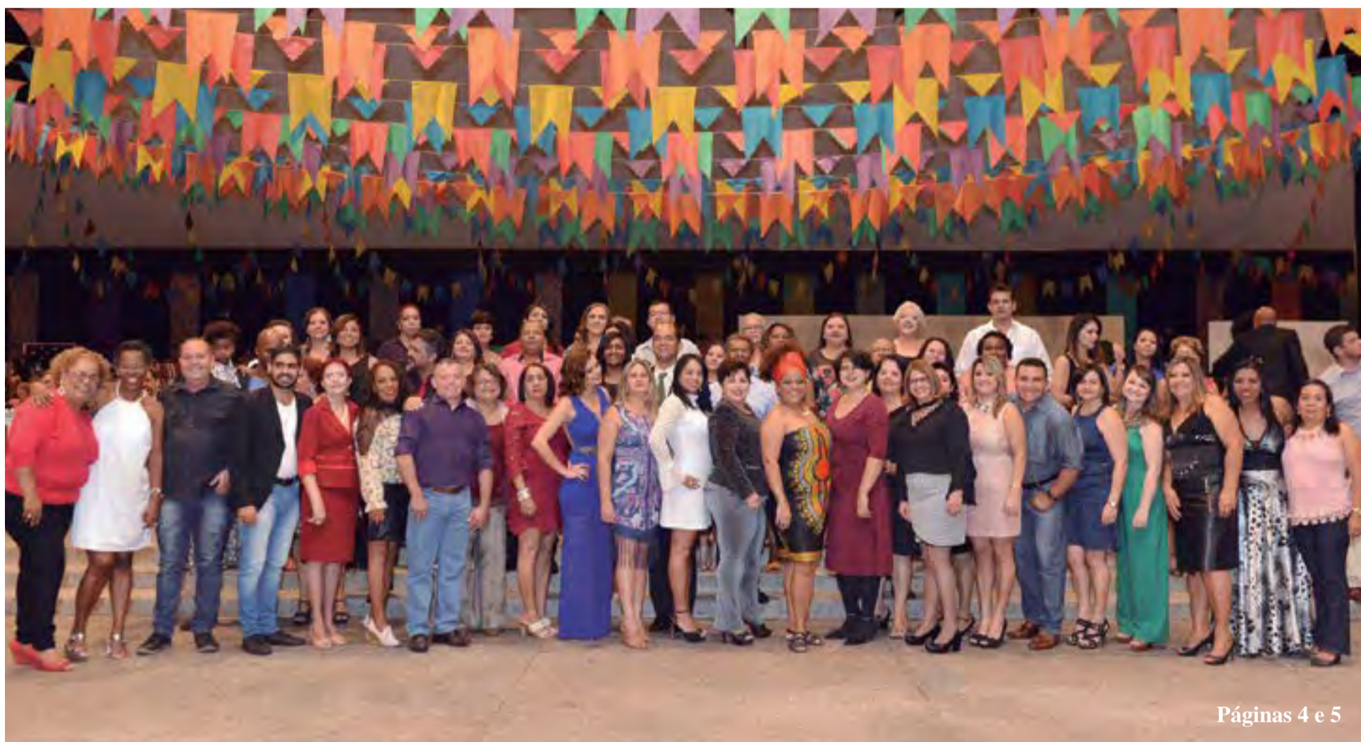
Páginas 4 e 5

Com votação expressiva Chapa 1 ganha as eleições do Sintego para o quadriênio 2017/2021 com 70% dos votos