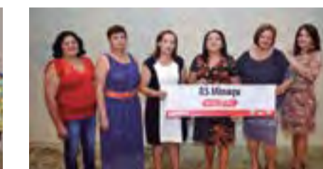
Regional de Minaçu manteve a tradição de muita luta e determinação