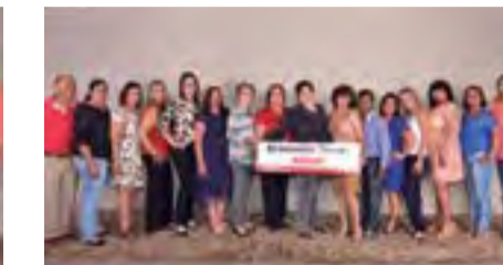
Regional de Goianésia mostra força com grande comitiva presente na posse em Goiânia