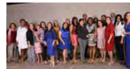
Direção Central e presidentes de regionais