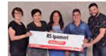
Regional de Ipameri com muita animação para o quadriênio 2017/2021