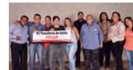
Regional de Planaltina conquistou bela vitória garantindo mais quatro anos de trabalho em prol da Educação