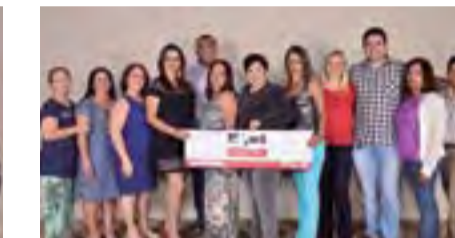
Regional de Iporá continua o trabalho de defender os educadores no Oeste Goiano